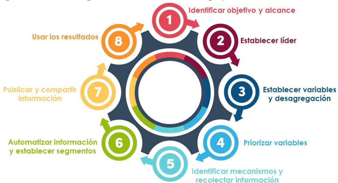
Figura 1. Metodología de caracterización de grupos de interés.