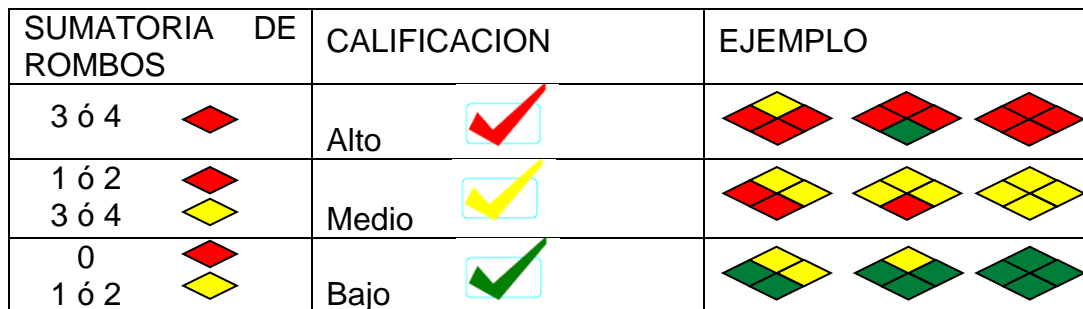
Tabla de Calificación nivel de riesgo

En el ejemplo del formato Consolidado Análisis de Riesgo , el diamante tiene dos (2) rombos rojos y dos (2) amarillos; su interpretación del nivel de riesgo asociado a la amenaza de Incendios, es Medio.